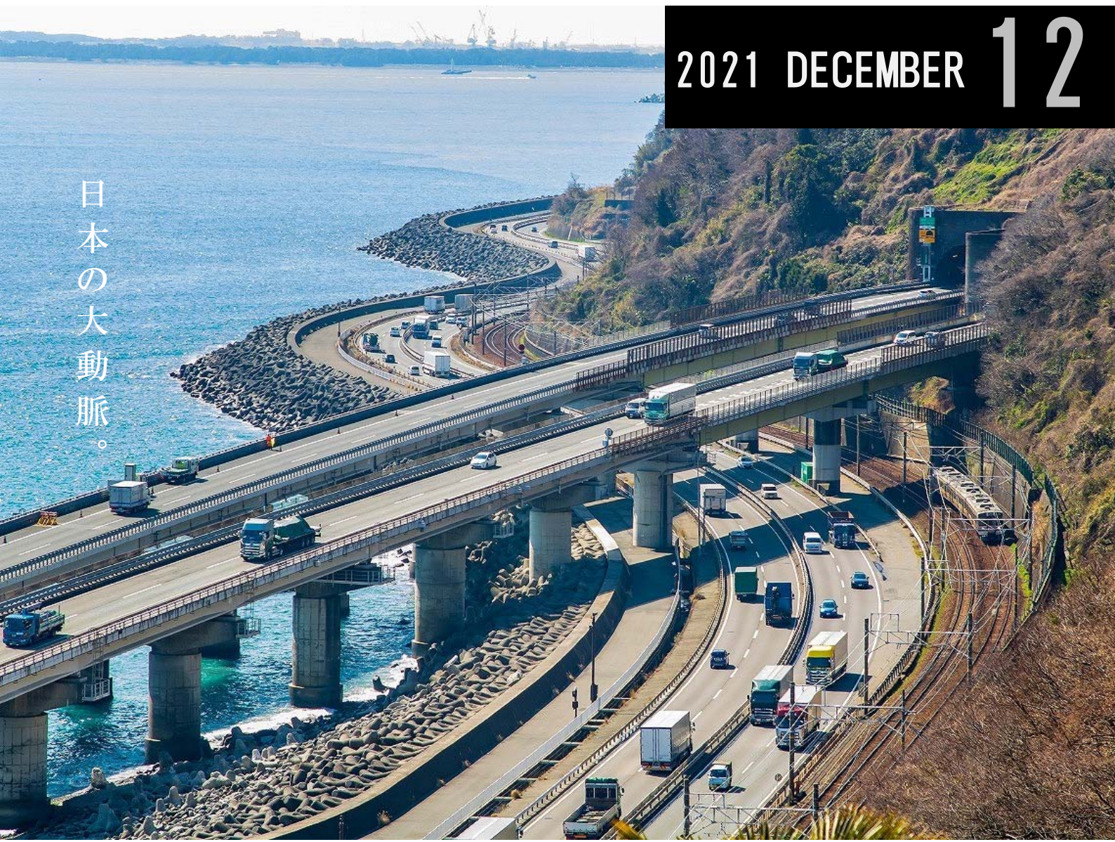
令和2年フォトコンテスト 一般の部 最優秀賞「交通の要衝」 撮影日：令和元年3月5日

(奥から) 清水港・国道1号富士由比バイパス・東名高速道路・JR東海道本線(静岡市清水区)