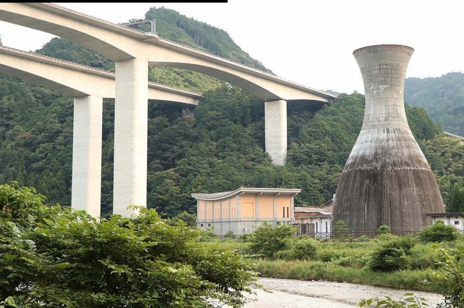
令和2年フォトコンテスト 学生の部 最優秀賞「巨大とっくり」 撮影日：令和2年8月13日

新東名高速道路新興津川橋と和田島浄水場の配水塔（静岡市清水区） 和田島浄水場：配水塔高さ45m 取水量10,000m 3 /日 昭和52年3月完成 和田島浄水場は、興津川上流域に位置し、場内の井戸から取水した水を滅菌後、隣接する高さ45mの「とっくり型」の配水塔に貯留したうえで、興津川流域の住民へきれいな水を届けています。この場所では、「とっくり型」の配水塔のほか弓型の屋根、アーチ型の橋桁等、様々な形のコンクリート構造物を一望できます。