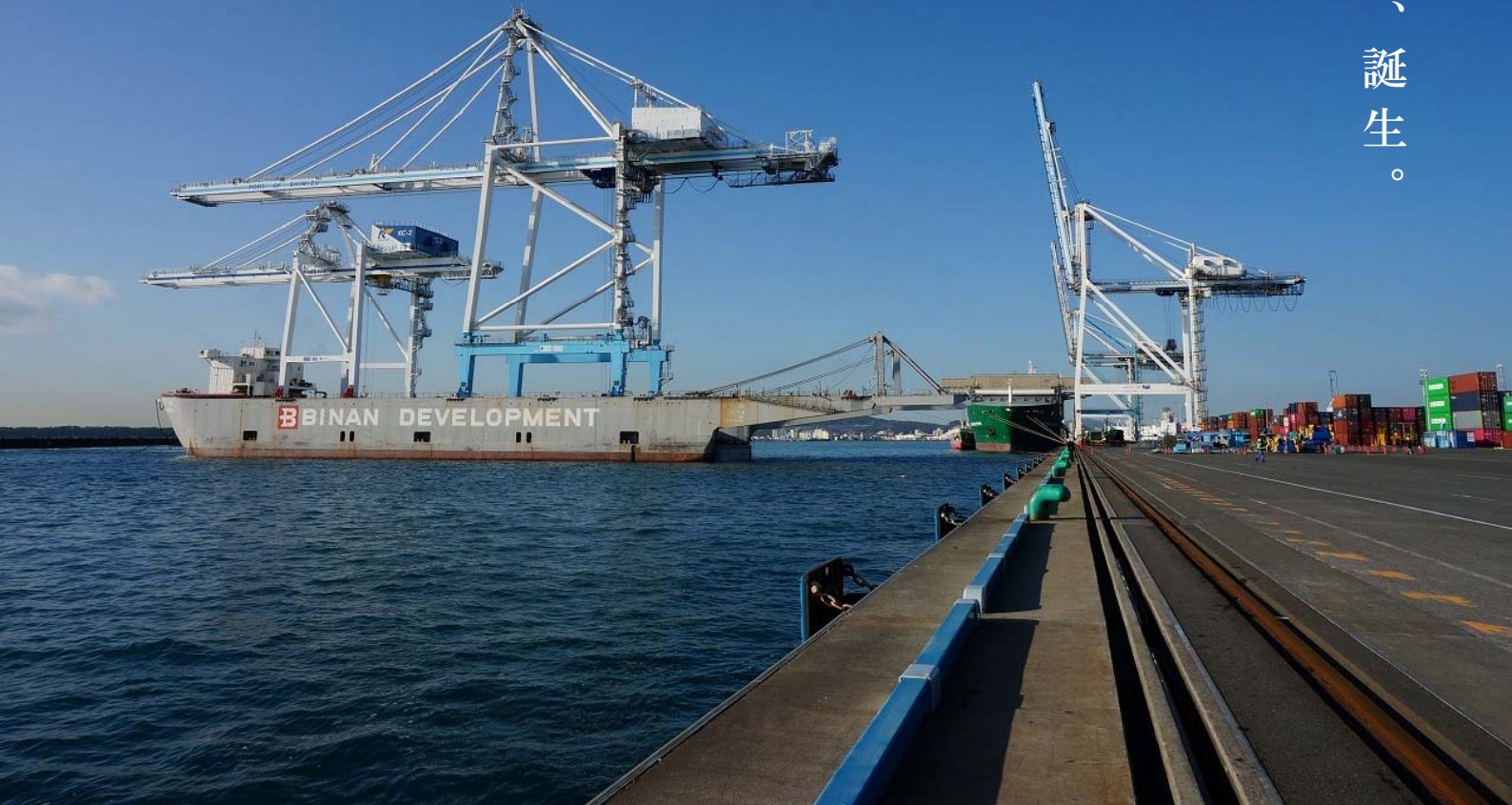
新興津コンテナターミナル (静岡市清水区)