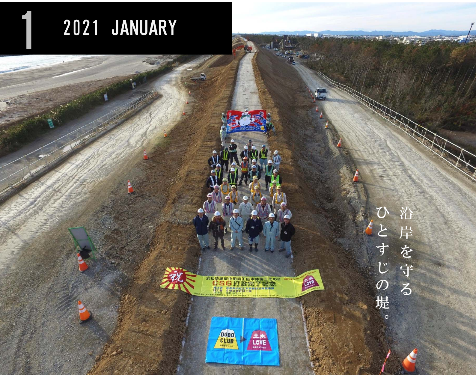
令和2年度 交通基盤部広報グランプリ 広報写真部門 銅賞 「命を守る防潮堤の核「CSG」打設完了」 撮影日：令和元年12月24日

浜松市沿岸域防潮堤（浜松市南区・西区）：延長17.5km（天竜川河口から浜名湖今切口） 標高13.0～15.0m