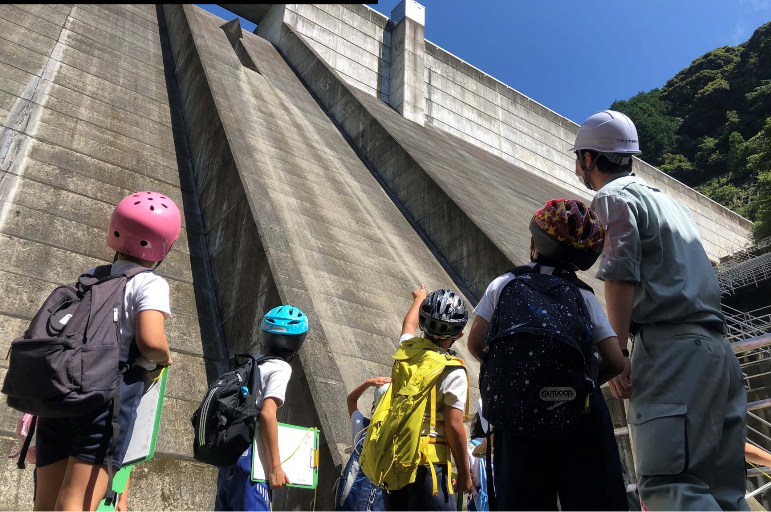
令和2年度交通基盤部広報グランプリ 広報写真部門 銀賞 「毎日安心して暮らせるのは、このダムのおかげなんだね！」 撮影日：令和2年9月9日

青野大師ダム（南伊豆町青野）：高さ39.5m 堤頂延長126.0m 総貯水量295,000m 3 平成18年8月22日完成