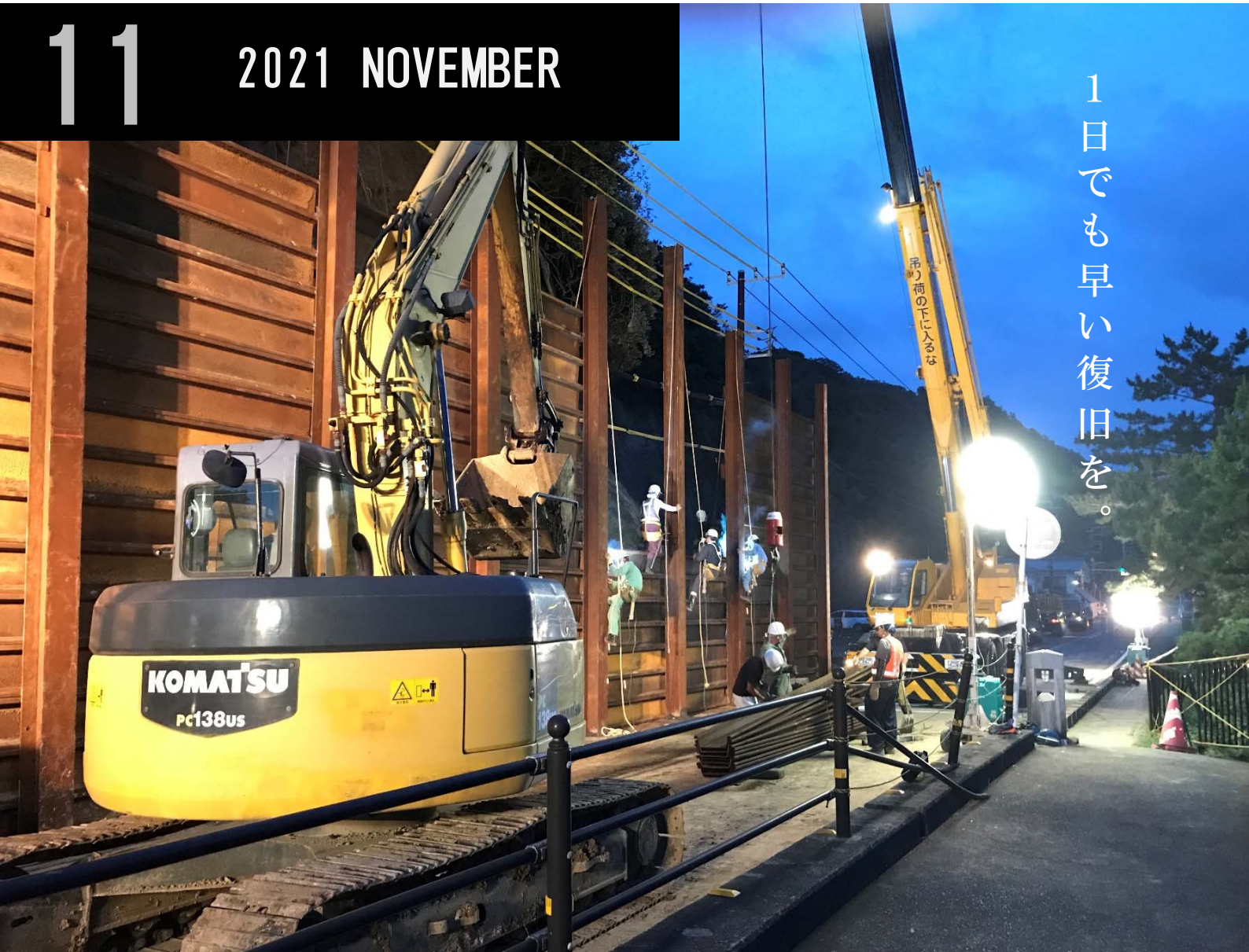
令和2年度 交通基盤部広報グランプリ 広報写真部門 金賞「少しでも早い規制解除を目指して」 撮影日：令和2年7月3日