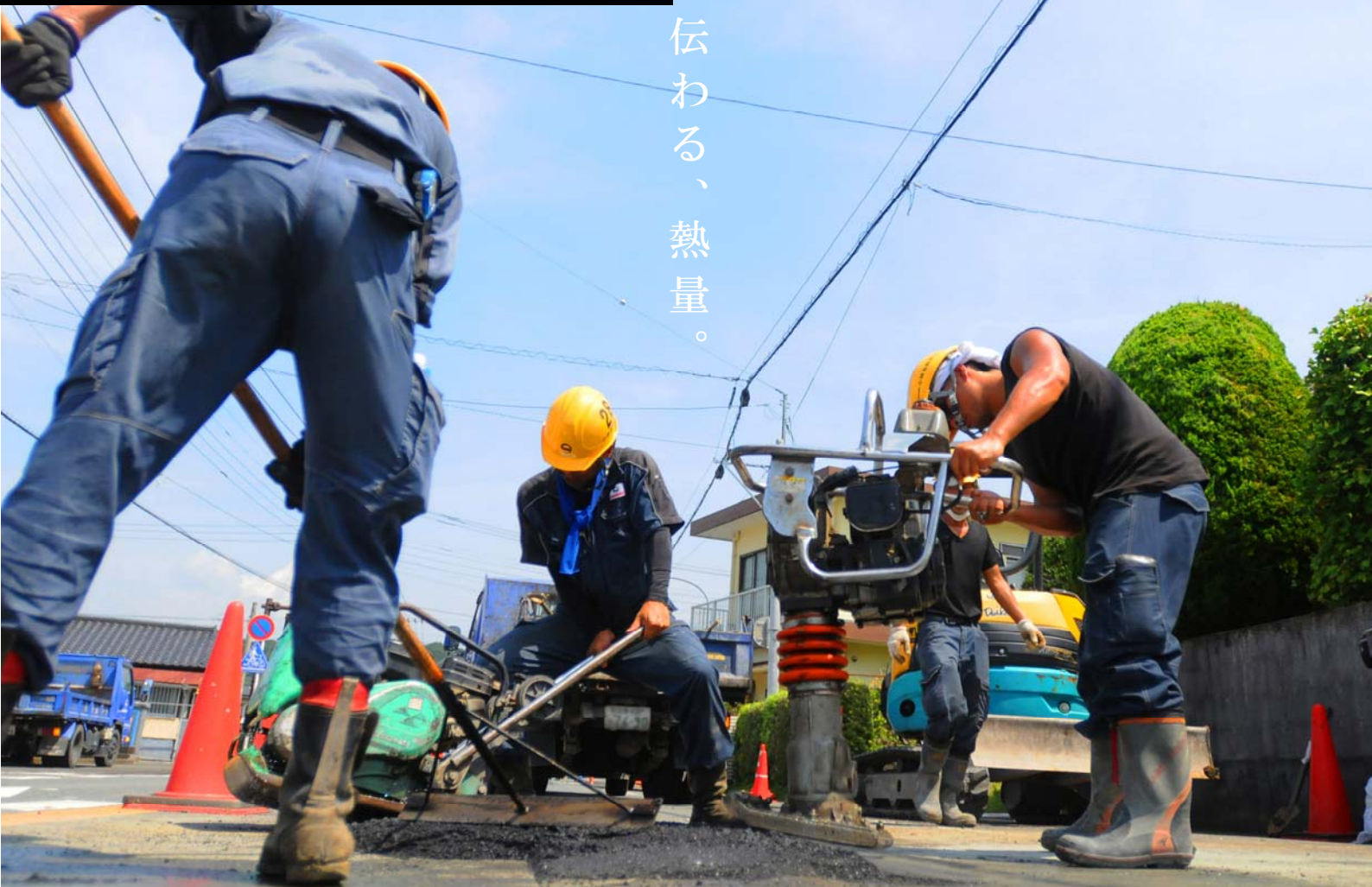
令和2年フォトコンテスト 建設産業の部 優秀賞「灼熱のアスファルト戦士」 撮影日：令和2年8月18日

県道函南停車場反射路線（伊豆の国市韭山）：延長約8.3km 幅員5.15m～23.5m